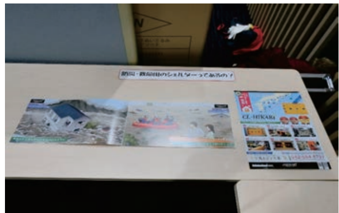
↑【防災・救命用シェルターのご案内】